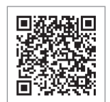
アプリダウンロード