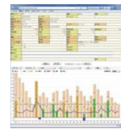
TenpoVisor 商品別売上グラフ

TenpoVisor POS は、店舗本部管理システムTenpoVisor のシステム内でご利用いただける Web 型のPOS システムです。追加料金は必要ありません。