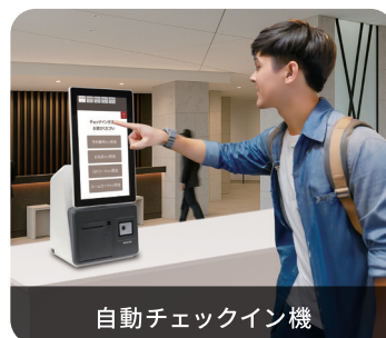
自動チェックイン機

●Intel、インテル、Intelロゴ、Intel Core、Celeronは、アメリカ合衆国および、またはその他の国におけるIntel Corporationの商標です。●Microsoft、Windows、Windows 10 Enterpriseは、米国Microsoft Corporationの米国およびその他の国における登録商標です。●QRコードは(株)デンソーウェーブの登録商標です。●その他記載されている会社名及びロゴ、製品名などは該当する会社の商標または登録商標です。●画像はイメージで、色合いなど実際とは異なる場合があります。●商品のデザイン・仕様・価格等は予告なく変更する場合や、取り扱いを中止する場合もありますのでご了承ください。●本カタログの記載内容を当社の許可無く転載・複写することを禁じます。