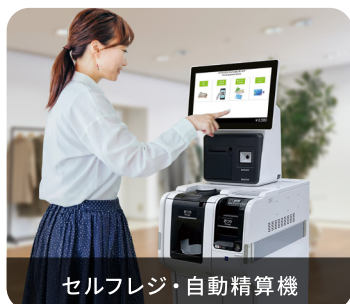
セルフレジ・自動精算機